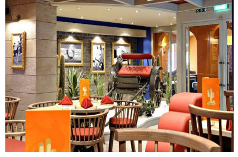
Tex Mex Restoran