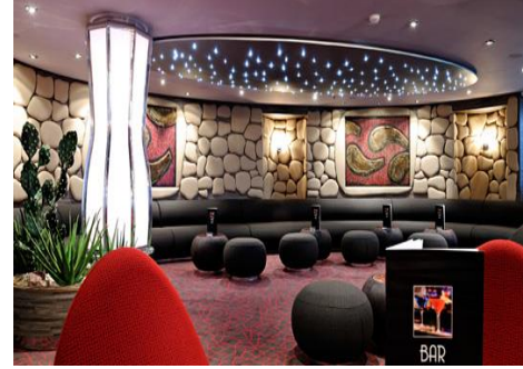
Golden Jazz Bar