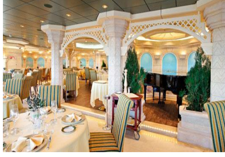
La Muse Restoran